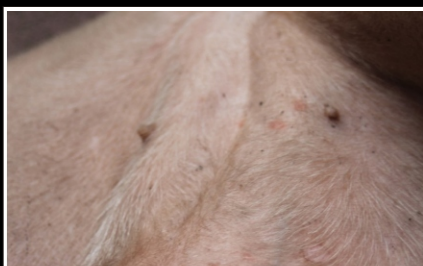
Deutliche allgemeine Rötung bei Éowyn am Bauch mit Pustelbildung.