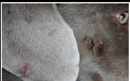
Auch am Ohr tiefe Kratzwunde bei Éowyn. Bei genauerem Hinsehen ist auch der "Mottenfraß" zu erkennen (dunkle Stellen im Fell).