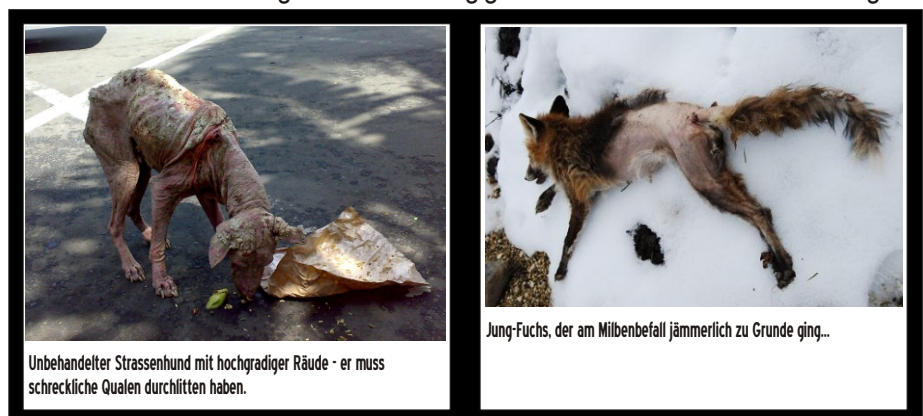
Unbehandelter Strassenhund mit hochgradiger Räude - er muss schreckliche Qualen durchlitten haben.

Milben, die der Wirt beim Kratzen oder Schütteln an die Umgebung abgibt, sind ohne Wirt etwa 18-21 Tage überlebensfähig und können einen neuen Wirt befallen. Die Ansteckung auf diesem Weg gewinnt immer mehr an Bedeutung!