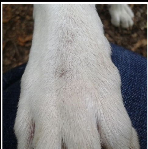
Auch an Amiras Vorderpfote die typischen kahle Stellen.