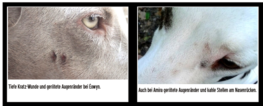
Tiefe Kratz-Wunde und gerötete Augenränder bei Éowyn.

Bei nicht gegen den Parasiten behandelten Wirtstieren (z.B. Wildtiere wie Fuchs oder auch Strassenhunde) ist es nur eine Frage der Zeit, bis die Sekundär-Infektionen zum Tod des Tieres führen - bis dahin erleiden sie jedoch Höllenqualen!